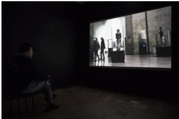
《 11,565Kilometers 》 展览现场

张北辰将错综复杂且隐秘的历史图像探索视为一种对他个人历史观的塑造过程。”11, 565这个项目中，我更想去创造出一个丰富的空间（它包括景观以及其背后错综复杂的历史线索），”他说，“更希望可以呈现一个用来连续思考，将我自己与观众都代入到那个时空中去。”