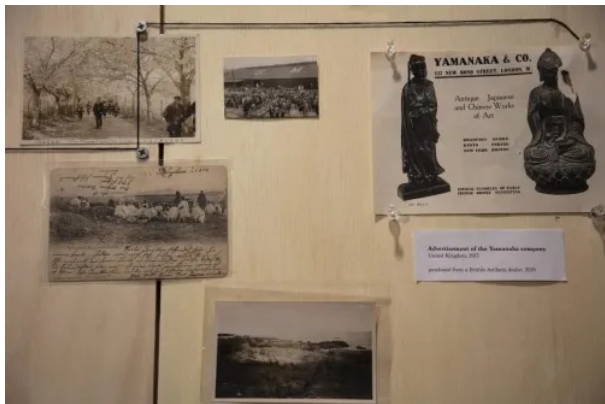
《 11,565Kilometers 》 摄影装置

作品并没有局限于单一媒介，张北辰还为此单独做了一组摄影作品装置，他将搜集到的1890年到一战前的珍贵图像，以及历史遗址的相关物品，进行历史遗址的线索分析与重新梳理，并进行模型化的重塑，可以对文物流转的路径与背景有更直观的认知。