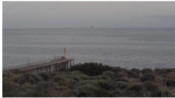
《 11,565Kilometers 》 影片截图

《11565公里》艺术项目包含一段31分钟的散文电影，这同时也是一部传记式纪录片，大量的固定镜头，用缓慢的节奏呈现出许多细节，建立一种现场目击的既视感，观者会不由自主联想到背后的隐藏历史。