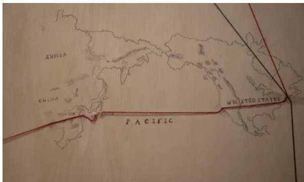
《 11,565Kilometers 》 摄影装置

此外，还包括一个3D打印而成的文物样本，和一本摄影书以及一个处在特殊场域（一个虚构的博物馆语境）的展览。