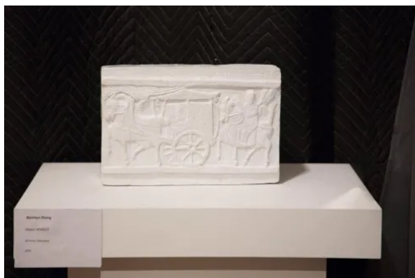
《 11,565Kilometers 》 3D打印样本