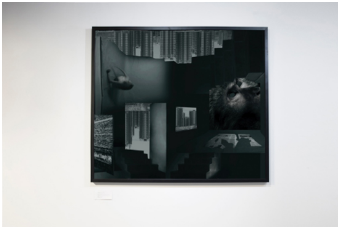
张北辰《镜像》系列2在纽约翠贝卡艺术画廊的展出，图片致谢New York Art Center in Tribeca

在张北辰的作品中，他以图像，报纸，铅板等材料共同创作出一个模糊了边界的拼贴，每一部分都像是被铺陈出来的调查面板，提供着解读画面另一部分的密匙。通过图像与讯息之间相互穿插和指引，艺术家把自身的周围现实景象和他质疑的陌生场面叠化在背景之中。在这里，材料变得复杂却又充满故事性，他们不仅构成了这个作品丰富的肌理，也隐喻着艺术家编码出的谜语空间的线索，使得图像背后的权力得以放大，对观者的凝视关系提出了假想。